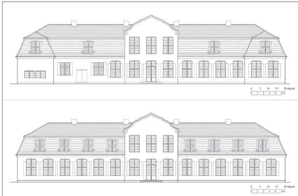
3. Rekonstrukcja elewacji Dworu II w Strzyży Górnej na podstawie analizy zapisów wyceny nieruchomości z 1814 r. (opracowanie autorki)

Można przypuszczać, że skrzydła boczne były przykryte podobnym mansardowym dachem, tak jak pokazał to autor rysunku z 1886 r. 44 Na podstawie informacji zawartych w opisie wyceny z 1814 r. oraz analizy rysunku podjęto próbę odtworzenia elewacji dworu – od strony podjazdu (północ) i ogrodu (południe) (il. 2, 3).