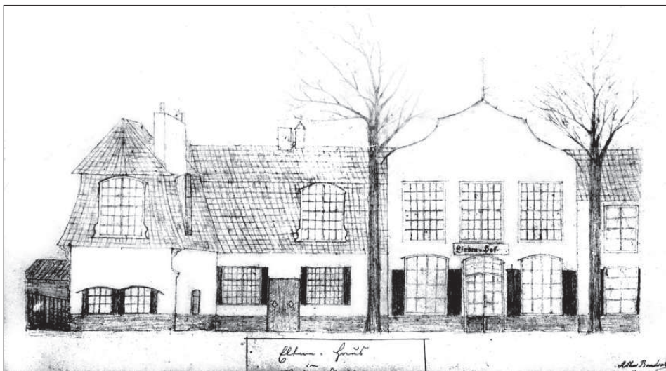
2. Widok Dworu II w Strzyży Górnej od strony północnej na rysunku Arthura Bendrata z 1882 r.

W 1814 r. dwór określony został jako „das herschaftliche Gartenhaus”, co zapewne miało podkreślić zarówno rozmach założenia, jak też jego integralne powiązanie z ogrodem. Budynek miał bardzo znaczną długość – 159 stóp (45,6 m) i zapewne około 11,5 m szerokości 40 . Wychodziły z niego w kierunku podjazdu dwa skrzydła boczne – jedno o długości 31½ (9 m) i szerokości 21½ stopy (6,2 m) i drugie odpowiednio: 20 x 24 stopy (5,74 x 6,9 m). Miał sklepione piwnice, był parterowy, nakryty wysokim dachem mansardowym 41 . W partii centralnej był dwukondygnacyjny. Jak wynika z opisu formy szczytu tej części budynku przez D. Chodowieckiego, była ona zbliżona do typowej dla gdańskich kamienic tego czasu. Na dziecinny rysunku z 1882 r., przedstawiającym widok dworu od strony podjazdu, pokazany został szczyt o przełamanej falistej linii splotów 42 . Pod gzymssem miała się znajdować wykonana w stiuku (tynku?) litera R 43 . Partia środkowa, być może akcentowana niewielkim ryzalitem, była trzyosiowa, partie boczne miały po 6 osi okiennych. W kondygnacji poddasza znajdowało się o dwa okna mniej.